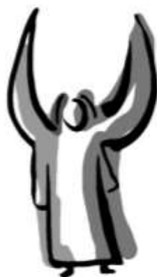
Grafik: Pfeffer (aus: Magazin Gemeindebrief)