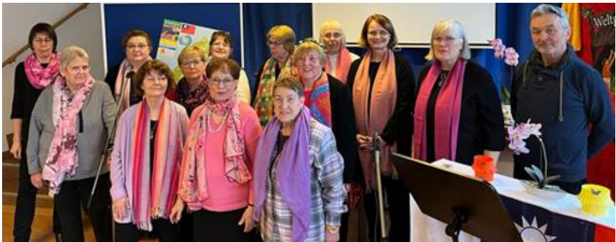
Das Weltgebetsteam 2023