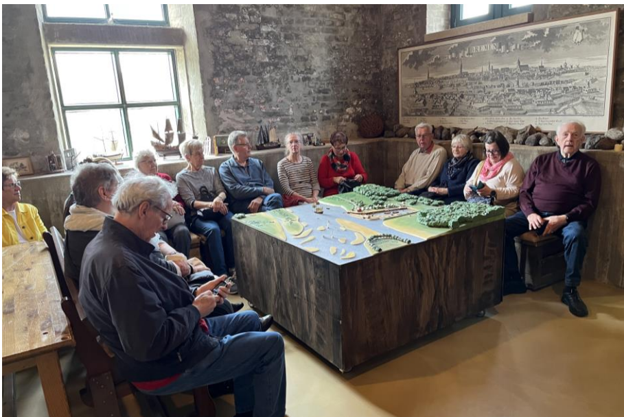
Mit dem Seniorenkreis im Vegesacker Geschichtenhaus am 04. Mai